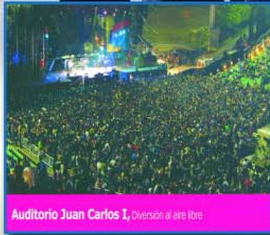
Auditorio Juan Carlos I, Diversión al aire libre

Asociación de Vecinos. C/ Veleros, 19. 28042 MADRID. Tel.: 91 324 98 30 • Fax: 91 240 73 61 DECLARADA DE UTILIDAD PÚBLICA MUNICIPAL